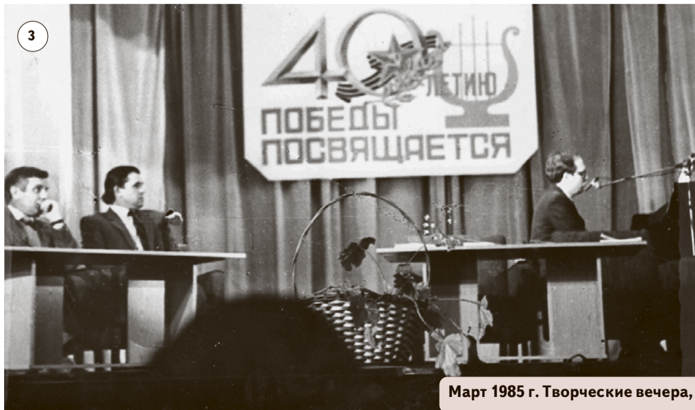
Март 1985 г. Творческие вечера, посвящённые 40-летию Победы